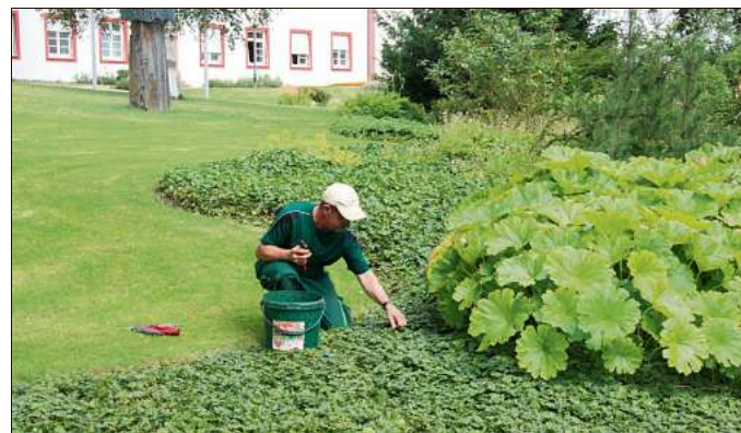
Die Parkanlage mit ihren schönen Sitzcken, Blumenrabatten, dem Wasserbiotop und die historischen Gebäuden wie die Klosterkirche prägen das Ambiente vom Vinzenz-von-Paul-Hospital.